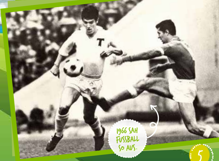
1966 SAH FUSSBALL SO AUS.

Eigentlich sollte dieses Jahr wieder eine Europameisterschaft stattfinden, sie wurde aber wegen der Corona-Krise auf nächstes Jahr verschoben.