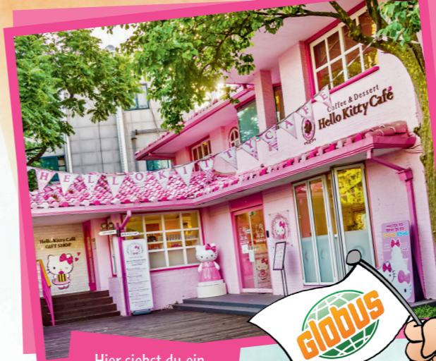
Hier siehst du ein Hello Kitty Café in Japan.